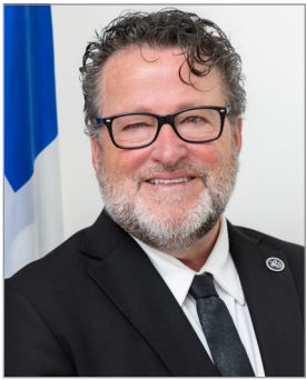
Donald Martel Ministre de l'Agriculture, des Pêcheries et de l'Alimentation et Ministre responsable de la région du Centre-du-Québec