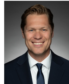
Alexis Deschênes Député de Gaspésie— Les Îles-de-la-Madeleine—Listuguji

Nous pouvons être fiers de notre mode de vie et de notre culture maritime unique qui se perpétue de génération en génération, et ce, depuis plus de 150 ans maintenant. Je souhaite à toutes les personnes œuvrant de près ou de loin au succès de l'industrie de la pêche une saison sous le signe de la sécurité et de la prospérité!