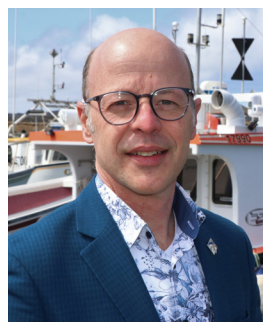
Joël Arseneau Député des Îles-de-la-Madeleine.

Les Îles-de-la-Madeleine Municipalité Les Îles-de-la-Madeleine Communauté maritime