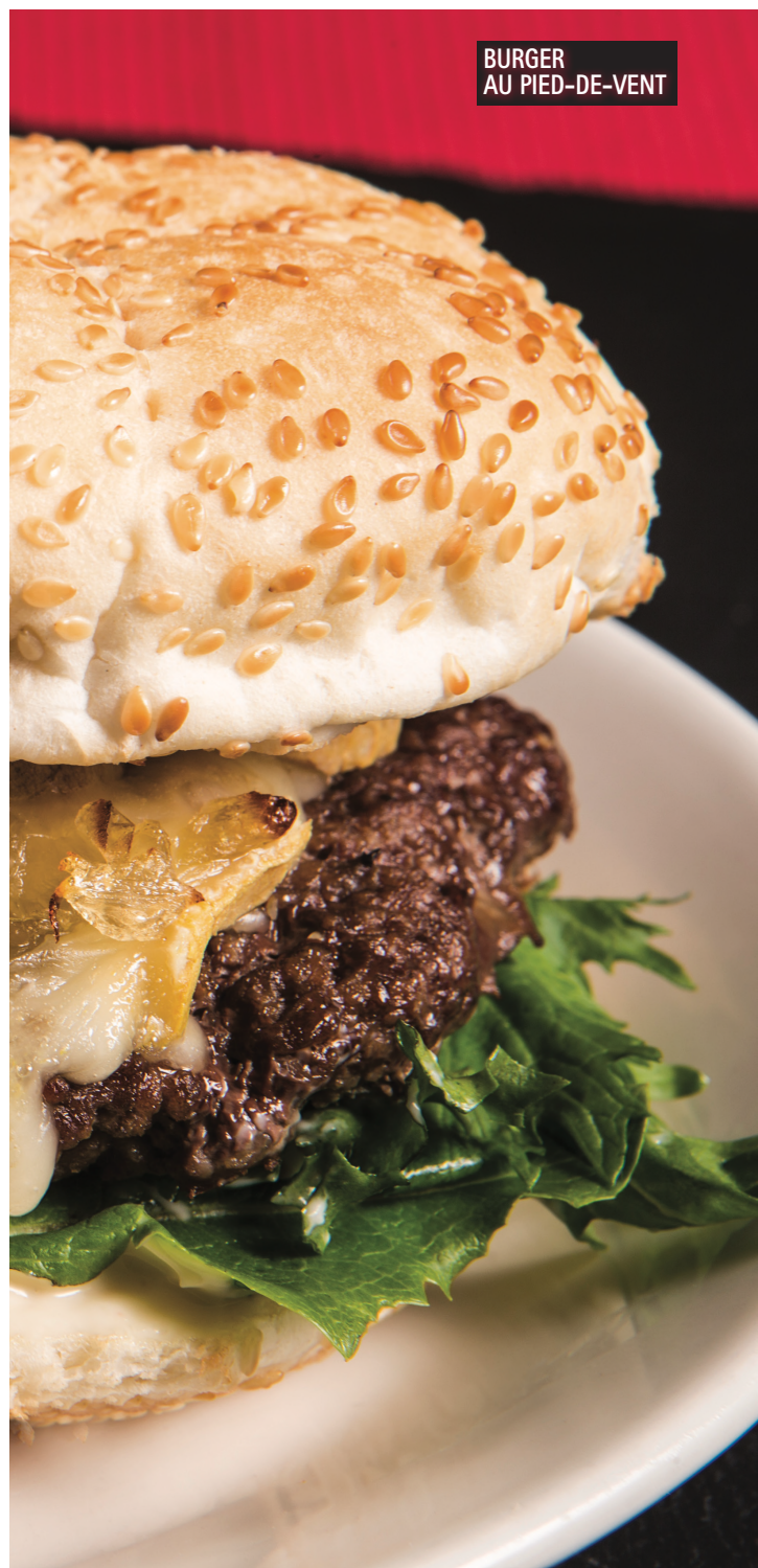
BURGER AU PIED-DE-VENT

Frites, riz, salade fusilli, salade césar, patates pilées ou salade verte