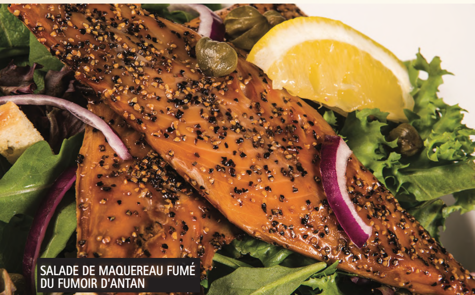
SALADE DE MAQUEREAU FUMÉ DU FUMOIR D'ANTAN

SALADE GRECQUE 19.75 (mélange de laitues saisonnières, concombres, tomates, olives Kalamata, oignons rouges, fromage feta, servi avec vinaigrette maison)