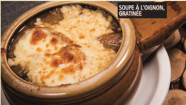
SOUPE À L'OIGNON, GRATINÉE