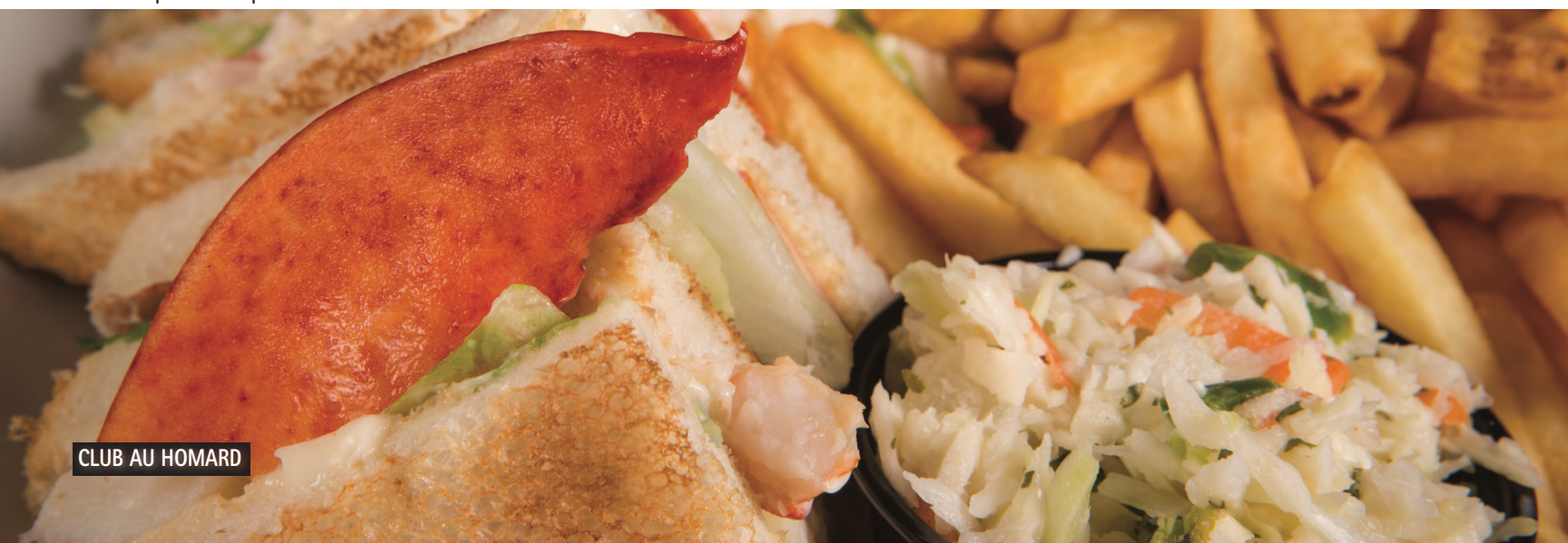
CLUB AU HOMARD