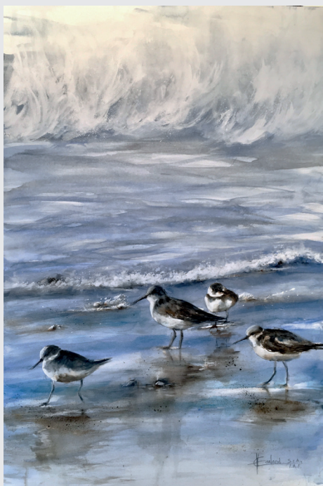
L'oeuvre « On les aime »

Pendant la semaine, ces artistes peintres provenant du Québec, des maritimes et des Îles se rassembleront pour magnifier à leur façon la beauté de nos paysages insulaires. À chaque jour, de 10h à 21h, le public est invité à se rendre au Site de la Côte afin de voir les artistes à l'oeuvre et échanger avec eux. L'événement se verra clôturer par un vernissage le dimanche 4 août de midi à 16h. Le gagnant du tirage de la toile de la présidente d'honneur y sera dévoilé.