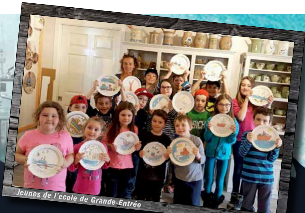
Jeunes de l'école de Grande-Entrée