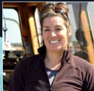
VICKY LEBEL LADY VICKY II