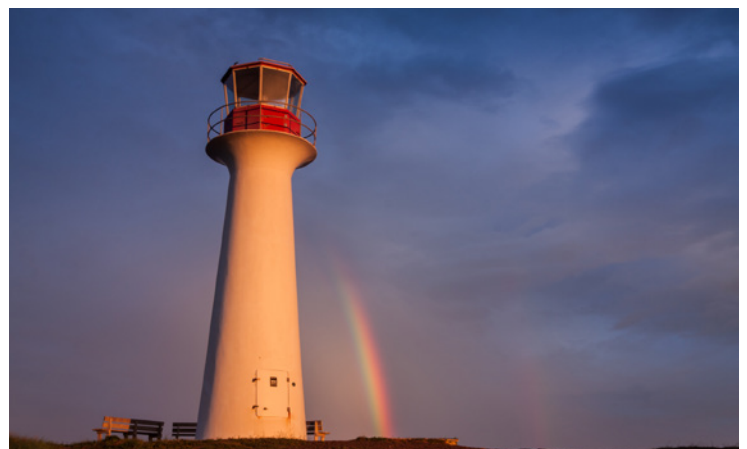
Photo de coucher de soleil au phare du Borgot. Un autre endroit populaire, mais qui comporte plusieurs perspectives peu utilisées à découvrir

Atelier théorique en après-midi orienté sur la technique photo, spécifique aux particularités de la photo de paysage.