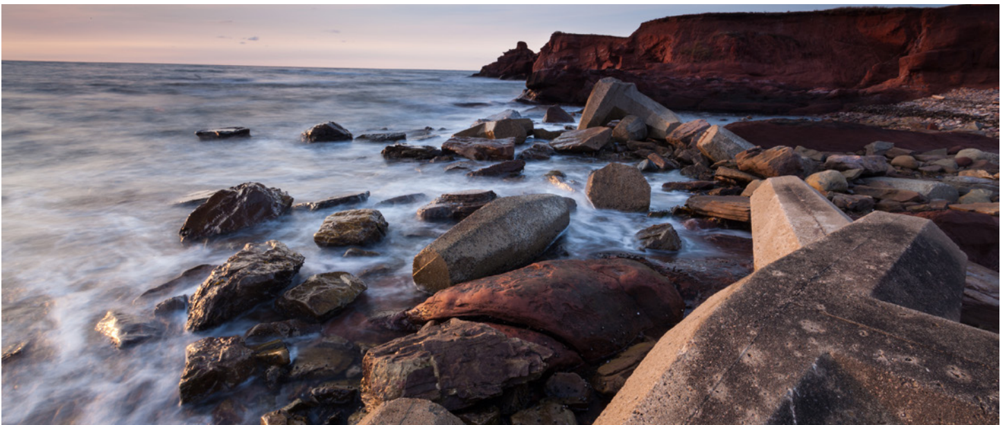
Photo en soirée au site de la Côte pour ensuite terminer l'atelier autour d'une boisson de votre choix au Café de la Grave ou à l'Abri de la Tempête.

25 juillet / 15 août - Il y a une journée flottante/libre pour la météo Nous aurons un peu de route à faire ce jour ci. Nous commencerons la journée à Old Harry avec sa magnifique plage. Nous irons ensuite à la Grande-Entrée photographier à l'île Boudreau ou à son havre de pêche.