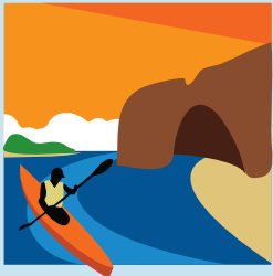
Sentier maritime Îles de la Madeleine